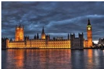
Il Palazzo del Parlamento inglese

95. Come è stato detto, tutti gli uomini sono per natura liberi uguali e indipendenti e nessuno può essere tolto da questo stato e sottomesso al potere politico di un altro senza il proprio consenso. L'unico modo in cui uno si priva della propria libertà naturale e accetta i vincoli della società civile è l'accordo