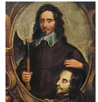
La decapitazione di Carlo I

199. Come l'usurpazione è l'esercizio di un potere a cui un altro ha diritto, così la tirannide è l'esercizio del potere oltre il diritto, a cui nessuno può aver diritto. E ciò consiste nel far uso del potere che uno ha nelle mani non per il bene di quelli che vi sottostanno, ma per il suo distinto vantaggio privato, quando cioè il governante, di qualunque titolo sia insignito, fa norma non della legge ma della propria volontà, e i suoi comandi e le sue azioni sono dirette non alla conservazione delle proprietà del suo popolo, ma alla soddisfazione delle proprie ambizioni vendette, cupidigie o altre passioni sregolate.