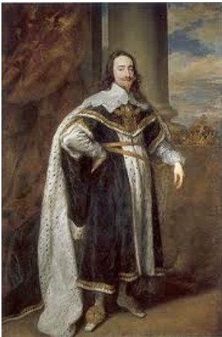
Carlo I Stuart

126. In terzo luogo, nello stato di natura manca spesso un potere che sostenga e sorregga la sentenza quando essa è giusta e ne dia la dovuta esecuzione.