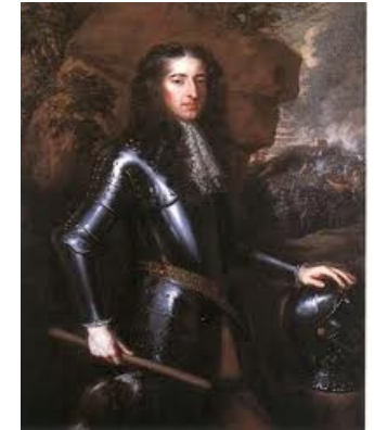
Guglielmo III d'Orange

Questo può essere fatto da un numero qualsiasi di uomini, perché non reca danno alla libertà degli altri che sono lasciati come se fossero nello stato di libertà proprio dello stato di natura. Quando un numero qualsiasi di uomini hanno a questo modo consentito di fare una comunità o un governo, essi sono immediatamente incorporati e costituiscono un unico corpo politico, nel quale la maggioranza ha il diritto di agire e di concludere per il resto.