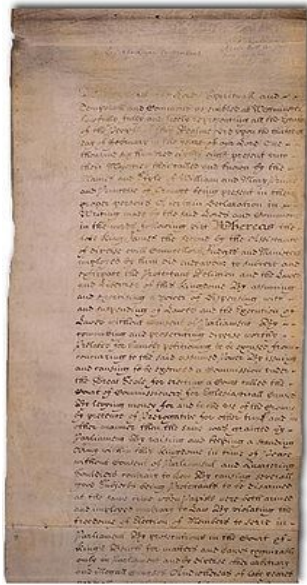
Bill of Rights (1689)

203. Ma allora ci si di un sovrano? Si che ci si trova offesi si immagina che egli che non aveva il sto scardinerà e tà politiche, e invell'ordine non la-fusione.